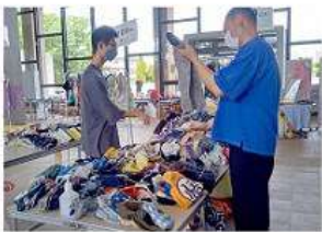
世代が違う人との出会いがうれしい