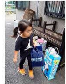
4歳 わたしも一緒にお手伝い