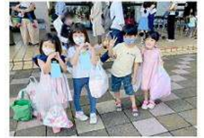
自分で選んでうれしいね♪