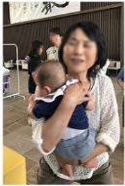
赤ちゃんとの出会いがうれしい