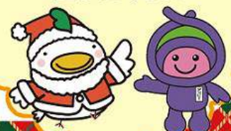
フルまる 上尾市アッピー