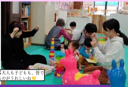
とある日の土曜日♪大人も子どもも、皆でいっしょにあそべるのがうれしいね♡